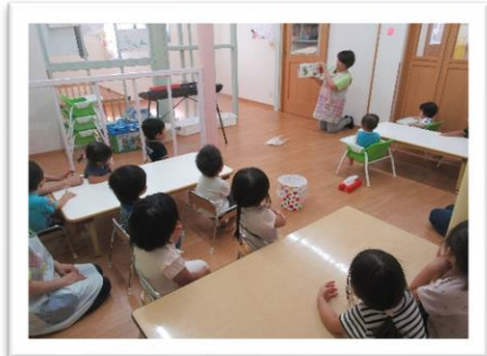
絵本の読み聞かせ