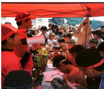
【こどもビンゴ大会】