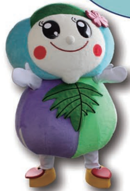
柏原市公認マスコット 「かしびよん」