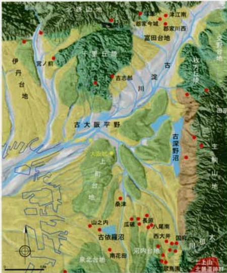
2万年前の大阪平野