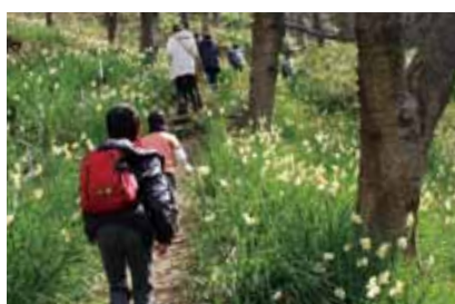
冬に水仙が咲く「高尾山創造の森」では、親子で低山ウオークを楽しめます。