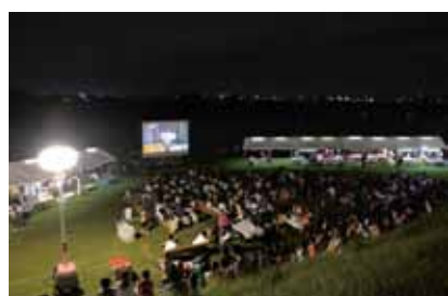
夏の夜、屋外にスクリーンを設置して映画を鑑賞する「スターナイトシアター」。

子どもたちが、外でのびのびと走ったり、ボール遊びをしたりできる環境が少なくなりつつある中で、市では自然と近い立地を生かした体験学習や川辺でのイベントなどを定期開催し、子どもたちが目を輝かせて植物や生物に触れる機会をつくっています。