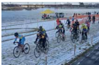
「2017-2018年シーズン 関西シクロクロス 2018 柏原シクロクロス大会」の様子。