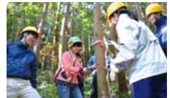
▲堅上小学校の間伐体験の様子

身近にある豊かな自然を生かして、田植え、葉っぱや土の観察、冬季にはぶどうのつるを使ったリース作り、間伐などの体験学習を実施しています。四季の移り変わりを肌で感じられる経験を通して、子どもたちの豊かな感性を育みます。