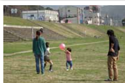
大和川河川敷公園は、子どもから大人まで身近な憩いの場となっています。