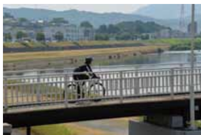
約21kmの「南河内サイクルライン」は初心者におすすめのコースです。