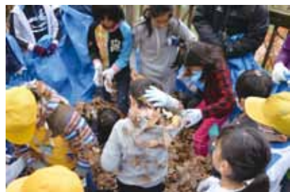
自然と近い立地を生かし、小学生を対象とした「森林体験学習」の様子。

また、河川敷内の公園では、ボール遊びをする家族、楽器の練習をする学生、冬にはたこ揚げをして走り回る子どもたちの姿が日常的に見られます。自然は子どもたちの身近な遊び場であり、その力を借りながら、子どもたちはたくましく、健やかに成長していきます。