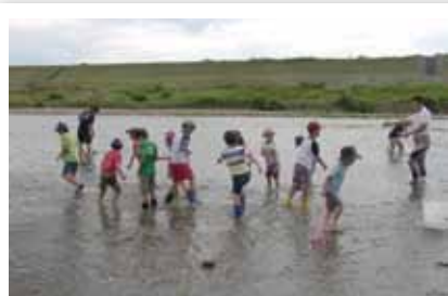
自ら大和川に入って、生息する生き物を観察するイベントもあります。