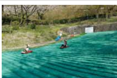
自然と遊具が充実した「市立玉手山公園ふれあいパーク」は無料で入場できます。