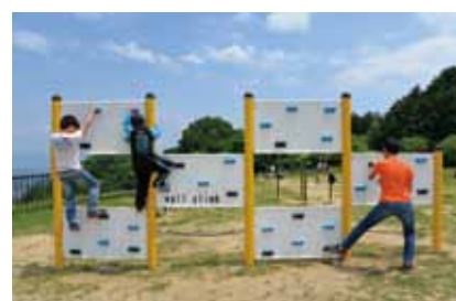
バーベキューやキャンプなどアウトドアを楽しめる施設「スマイルランド」。