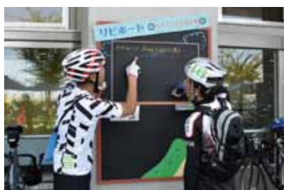
市民文化会館前には、サイクリストのための掲示板が設置されています。