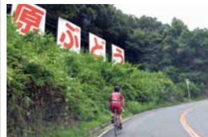
サイクリストの間で「 ぶどうが 葡萄坂」と呼ばれるヒルクライムの名所があります。

休 日には、ウォーキングやサイクリングなどでリフレッシュできる最適な自然環境が、市の大きな魅力のひとつです。特にサイクリングは近年人気が高まっており、大和川沿いの爽やかな風や山手の坂道を求めて、多くのサイクリストが市内外から集まります。市では、山と川の地域資源を生かして地域活性化につながる取り組みのひとつとして、地域の企業や団体と協働し、自転車レースの企画をはじめとする「自転車の聖地かしわら事業」を進めています。