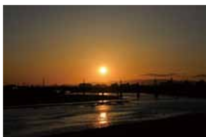
大和川と夕日は相性抜群。サイクリングや散歩をしながら景色を堪能できます。