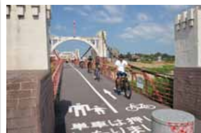
市やサイクルショップなどで、市内を巡るサイクリングツアーが開催されています。