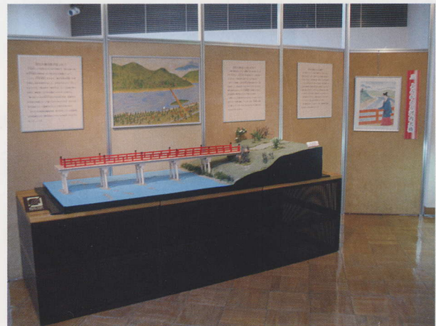
春季企画展展示風景