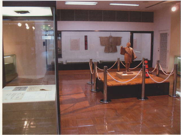
春季企画展展示風景